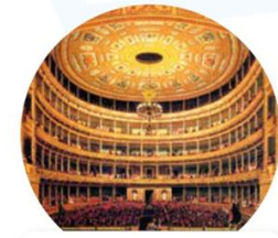
El Teatro Santa Anna o Teatro Nacional de México tuvo una vida de 1844 a 1901.

Contrasta la información que investigaste con la que acabas de leer y representa tus conclusiones en un plan o tratado de paz. R L