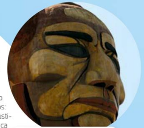
Museo Cabeza de Juárez, Iztapalapa, Ciudad de México.

Ante la crítica de Bulnes, los liberales, particularmente el grupo de los llamados científicos, cerraron filas y se apresuraron a la defensa de la figura de Juárez. El intelectual Justo Sierra Méndez 🇲🇽, publicó su libro Juárez, su obra y su tiempo , escrito con la intención de refutar punto a punto la crítica de Francisco Bulnes y exaltar la figura de Benito Juárez. ¿Qué le convenía más al gobierno en ese momento, un Juárez héroe de la patria o un Juárez humano, contradictorio, pero más real? En 1910, en la celebración del Centenario de la Independencia, cuando se inauguró el Hemiciclo a Juárez en la Ciudad de México, la polémica estaba decidida: convenía más que Juárez fuera el héroe histórico porque servía de pilar para una nación que se estaba reconstruyendo y fortaleciendo para encaminar al progreso y la modernidad. ¿Qué otros políticos se han convertido en “héroes” en el transcurso de la historia? ¿Qué figuras públicas crees que podrían convertirse en ejemplos 🇲🇽 para la historia en el futuro?