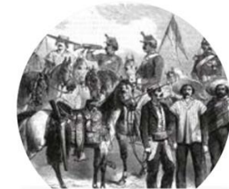
Soldados del Ejército Mexicano en la Guerra de Reforma.

Imagina que entrevistas a un francés que acompaña a Maximiliano y a un soldado del ejército mexicano. ¿Qué preguntas les harías? Escríbelas y respóndelas al finalizar la Esfera. R L