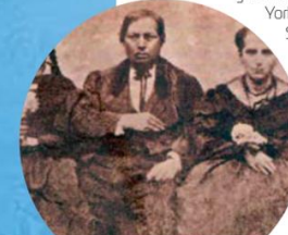
Fotografía de Benito Juárez y su esposa Margarita Maza.