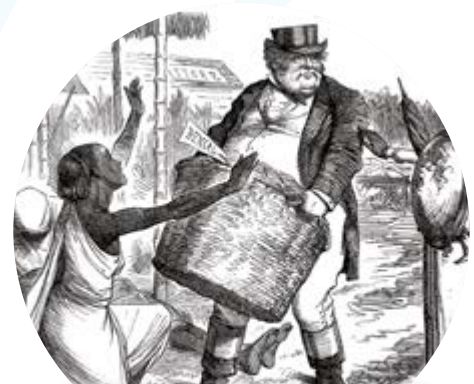
Caricatura de sátira británica sobre su dominio en África.

¿Qué países participaron en la Conferencia de Berlín? ¿Alguno de ellos era africano? ¿Qué opinas de la repartición de África?