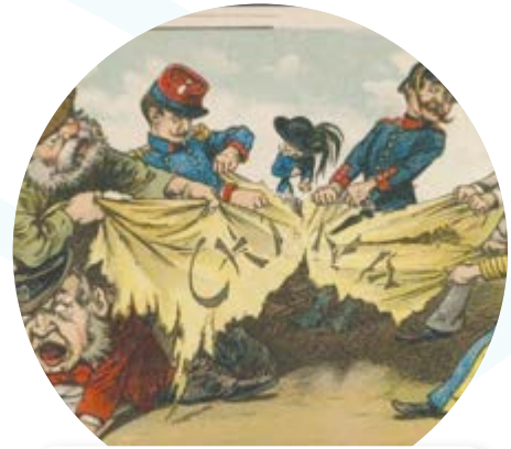
Repartición de China tras la rebelión de los bóxers (1900).

Las diferencias por la repartición desigual de los territorios colonizados inició la formación de alianzas y agravó las rivalidades entre las potencias que años más tarde desataron la Primera Guerra Mundial.