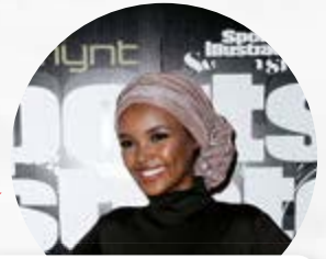
Halima Ad es una supermodelo que siempre usa hijab.

Como sabes, en muchos reglamentos deportivos se precisa el tipo de uniforme que debe usarse 🧑. ¿pero qué pasa cuando ese tipo de vestimenta va en contra de valores relacionados con la religión o la moral individual 🧑? ¿Un deportista profesional debe hacer a un lado sus creencias o los reglamentos deben replantearse si la vestimenta en realidad es un impedimento para participar 🧑? Para dar respuesta a estas cuestiones, te invitamos a ponerte en el papel de una voleibolista que usa burkini 🏐.