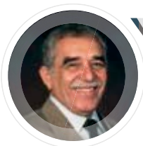
Gabriel García Márquez

01 Lee el texto y escribe qué relación tiene con tu identidad.