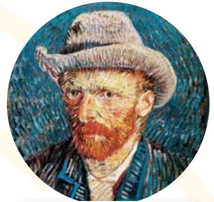
Autorretrato con sombrero de paja (1887), Vincent Van Gogh. ¿Qué parte de su personalidad crees que deseaba expresar el artista al usar esos colores y esa técnica? ¿Qué emociones te provoca esta selfie de Van Gogh?

Busca dos fotografías: una de cuando eras bebé 🍼 y otra de cuando tenías 8 años 🧒. Imprímelas y pégalas en este espacio. Luego, responde.