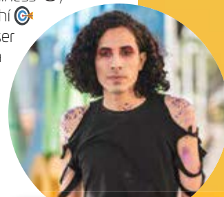
Los queer nacen de la regla general de la ruptura total de estereotipos de género.