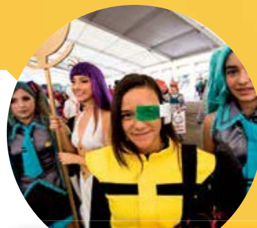
Los otakus son consumidores de anime y manga japonés. Suelen acudir a convenciones donde muestran sus habilidades en la confección de disfraces o cosplays.

Sin embargo, independientemente de cuáles sean nuestras motivaciones 🧑, en toda búsqueda existe un deseo de encontrar quiénes somos. Al final, lo que estamos haciendo es una exploración de nosotros mismos 🧑 a través de la manera en que nos relacionamos con los demás 🧑🧒. Y así como tú y yo pasamos y pasaremos por diferentes etapas, las demás personas también lo harán 🧑. De todos depende respetar los otros caminos 🗣️. Entonces, ¿qué piensas? ¿Consideras importante la diversidad de las culturas? ¿Será complicado intentar entender a los otros en lugar de alzar una barrera? 😊