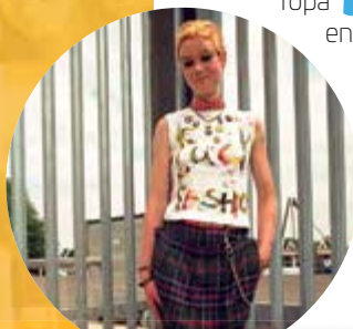
Los punks son de ideales contrarios al fascismo, imperialismo y capitalismo. Suelen reconocerse como miembros de extrema izquierda.

La palabra cultura es uno de los términos más usados y discutidos 🗣️ en numerosos ámbitos y disciplinas del saber. Si nos basamos en las sociedades, podemos decir que la cultura es un conjunto de signos (como la comida 🍲, la ropa 👕👖, las fiestas, la religión) que distingue a un grupo social. Una cultura siempre está en movimiento 🔄, se reinventa, da lugar a otras, absorbe nuevos rasgos, es múltiple. En eso radica su riqueza.