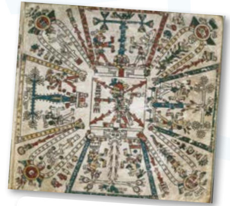
Mapa cosmológico del Códice Fejérváry-Mayer, manuscrito mexicano del centro de México (1400-1521).

Dibuja, resume, pega, ¡lo que quieras! ✎