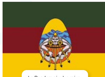
La Bandera ajuuk o mixe.