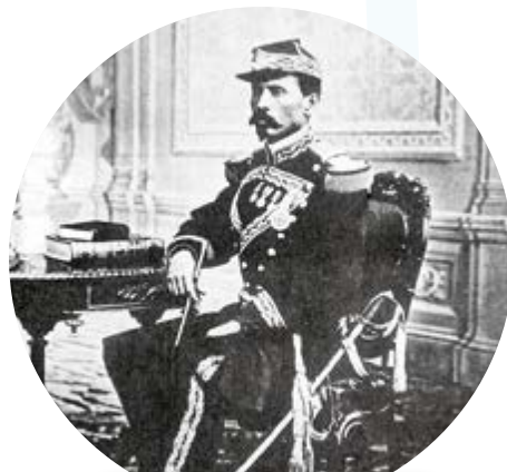
Durante la Guerra de Reforma, Porfirio Díaz luchó del lado liberal.

Reflexiona sobre las preguntas de la sección ANALIZO , ¿ya puedes contestarlas? Escribe tus respuestas, considera lo que aprendiste en esta Esfera de Exploración.