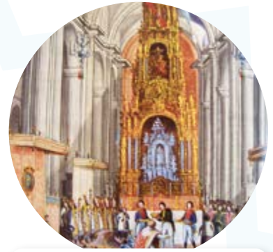
Solemne coronación de Iturbide en la Catedral de México, 21 de julio de 1822. Aguafuerte, Museo Nacional de Historia.

¡Redacta una proclama para representarlas!