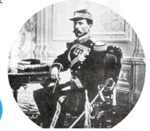
Durante la Guerra de Reforma, Porfirio Díaz luchó del lado liberal.

¡Regresa a la página 49 y responde las preguntas que planteaste en ese momento 😊!