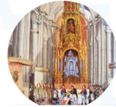
Solemne coronación de Iturbide en la Catedral de México, 21 de julio de 1822. Aguafuerte, Museo Nacional de Historia.

¡Redacta una proclama para representarlas!