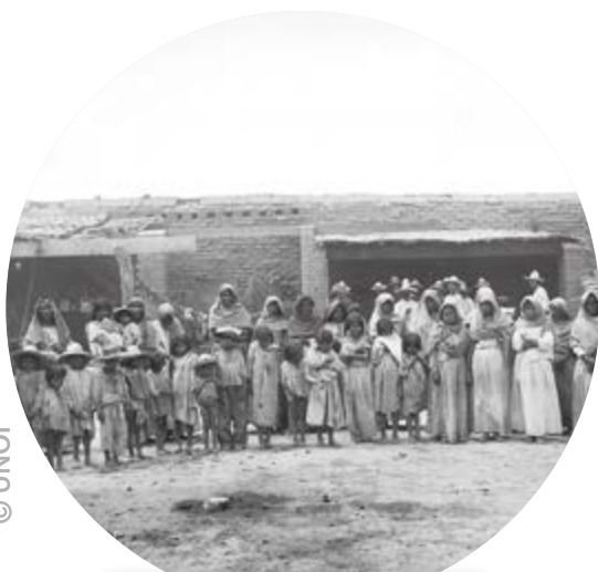
El gobierno de Díaz tomó prisioneros a niños y mujeres yoremes.

Escribe 5 preguntas sobre las comunidades indígenas en el siglo XIX y en la actualidad en México y compártelas en tus redes sociales. Al finalizar la Esfera, escribe aquí las respuestas que enviaron tus contactos . R. L.