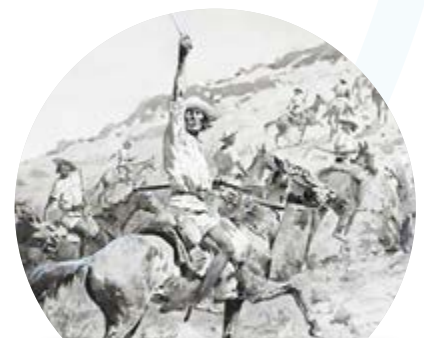
La resistencia yoreme (yaqui) de México en el siglo XIX.