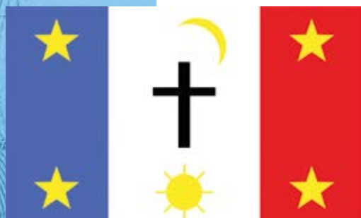
Bandera de la nación yaqui.

Aunque desde el Virreinato existía el concepto de la “propiedad comunal” de las tierras de los pueblos de indios, con la entrada del liberalismo de los Estados modernos se promovió la propiedad individual en detrimento de la colectiva. Las Leyes de Reforma estuvieron encaminadas a romper los gremios de todo tipo: mineros 🏠, religiosos 🏛️ y campesinos 🚗. Los gobiernos de Juárez, asignaron a los indígenas la figura de campesinos “modernos” o pequeños propietarios 😎 y bajo ese discurso expropiaron algunas de sus tierras 🤔. ¿Cómo respondieron los grupos indígenas a esta situación?