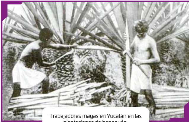
Trabajadores mayas en Yucatán en las plantaciones de henequén.