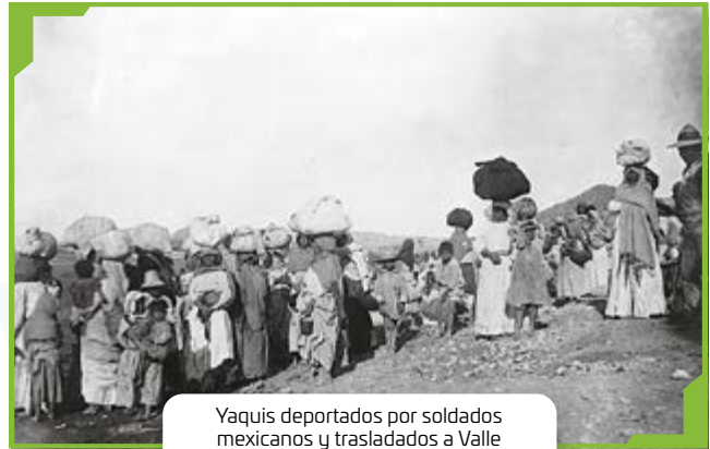
Yaquis deportados por soldados mexicanos y trasladados a Valle Nacional (Oaxaca).