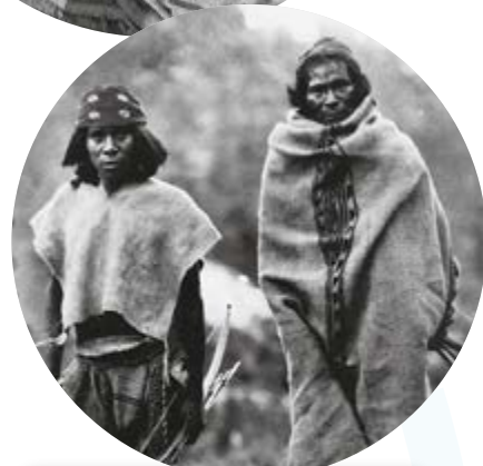
Rarámuris (tarahumaras) de Chihuahua en 1892.

Escribe 5 preguntas sobre las comunidades indígenas en el siglo XIX y en la actualidad en México y compártelas en tus redes sociales. Al finalizar la Esfera, escribe aquí las respuestas que enviaron tus contactos . R. L.