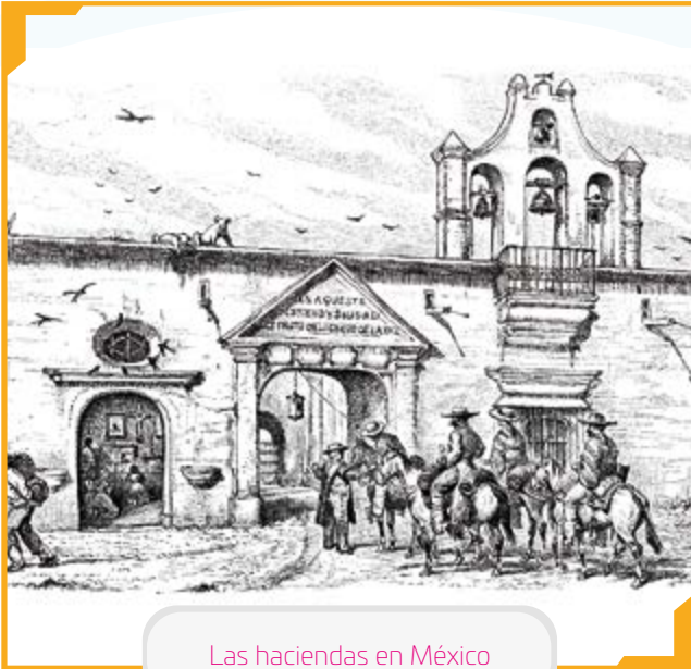
Las haciendas en México

Observa las imágenes y coloca un título a cada una. Considera que ambas son de México en el siglo XIX. R. M.