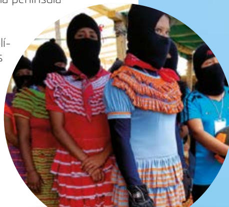
Actualmente en los “Caracoles”, Chiapas, los pueblos indígenas ejercen su autonomía.

La realidad no ha sido muy distinta: se les ha mantenido al margen de los proyectos de nación. Durante el siglo XX, en 1994, el Ejército Zapatista de Liberación Nacional promovió la autonomía de los pueblos indígenas del sur del país y algunas comunidades lograron y mantuvieron su autogobierno, cultura y formas de organización y han resistido la persecución, a las empresas multinacionales y a la delincuencia organizada. ¿Qué políticas públicas propondrías para mejorar la calidad de vida de los pueblos indígenas e incluirlos en los proyectos de nación sin dejar de respetar sus características específicas? 🧑