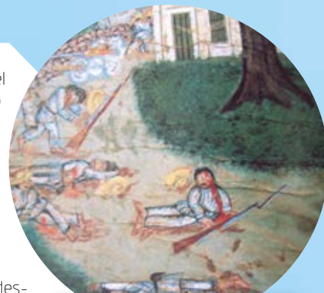
Una escena de la Guerra de Castas . Óleo sobre lienzo, anónimo, 1850.

Al iniciarse este proceso, se abolió el sistema de castas y la esclavitud; años después, tras su consumación, se otorgó la ciudadanía a todos los habitantes (aunque el ejercicio de sus derechos políticos estaba condicionado). Pero, ¿qué significó esto exactamente? Para las personas de los pueblos indígenas, el paso legal de súbdito a ciudadano no era algo fácil de comprender 🤔, ya que era una condición social que, dicho sea de paso, no habían solicitado, ni comprendían por qué ese “beneficio” los obligaba a pagar impuestos o a perder sus tierras. ¿Pooooor 🤔?