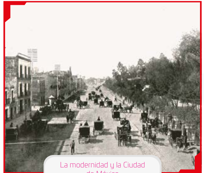
La modernidad y la Ciudad de México