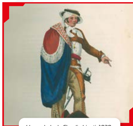
Hacendado de Claudio Linati, 1828.