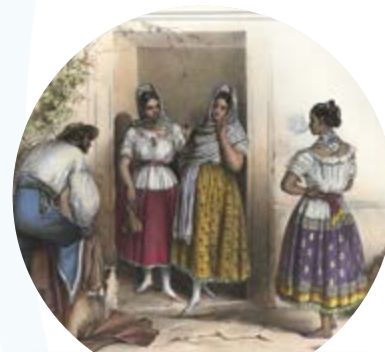
Composición de la sociedad mexicana del siglo XIX, Poblanas , de Carl Nebel, 1836.

03 Anota la letra que une al grupo social mexicano de la segunda mitad del siglo XIX con sus características. +1