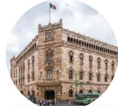
Palacio de Lecumberri (arriba) y Palacio Postal, en la CDMX, obras del Porfiriato.