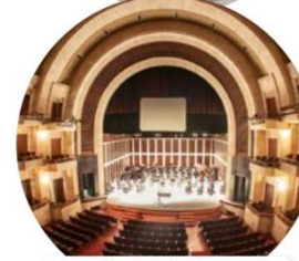
Teatro Macedonio Alcalá, en Oaxaca, y Teatro de la Paz, en San Luis Potosí, inaugurados en 1909 y 1894, respectivamente.