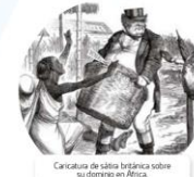
Caricatura de la repartición de África.

¿Qué zona defenderías? ¿Con qué fines consultarías el documento? ¿Cómo se lo harías saber a los países involucrados en la repartición de África?