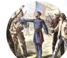
Un soldado estadounidense se interpone entre un grupo de afroamericanos liberados y un grupo de blancos (1868).

R. M. Representó un avance en justicia social. La desventaja fue que en los estados del sur surgieron muchos conflictos por adaptarse a una nueva realidad. Además, la discriminación siguió presente.