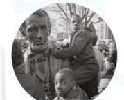
Aunque la emancipación de la población afrodescendiente en EUA ocurrió en 1863, cien años después la lucha por los derechos de esta población sigue vigente.

Reflexiona sobre las preguntas de la sección ANALIZO . ¿Ya puedes contestarlas? Escribe tus respuestas con base en lo que aprendiste en esta Esfera de Exploración.