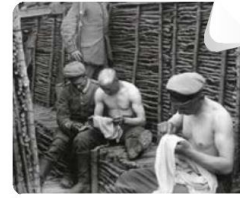
En una trinchera alemana, los soldados le quitan los piojos a su uniforme (1915).