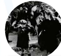
Familias judías asustadas se rinden ante los soldados nazis en el gueto de Varsovia en 1943.