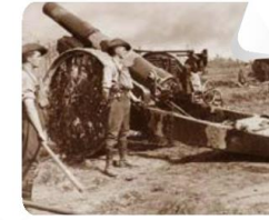
La artillería pesada, una innovación de la Primera Guerra Mundial, causó destrucción en todos los frentes.