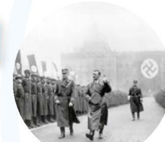
El canciller Adolf Hitler inspecciona una sección del ejército nazi en Berlín el 8 de noviembre de 1937.

Para conocer más sobre los habitantes de los campos realiza un cuadro que contenga: nombre del campo, periodo de funcionamiento, a quiénes enviaron ahí, cuántas personas estuvieron y quiénes trabajaban en él 📋.