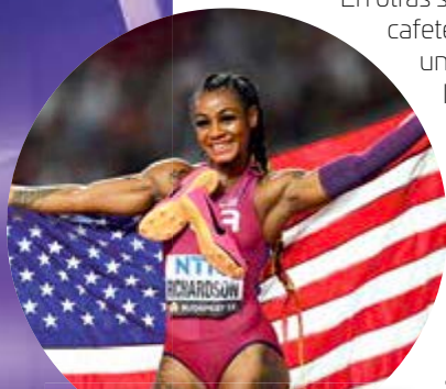
Sha'Carri Richardson, la mujer más veloz del planeta, corrió los 100 m en apenas 10.65 s en el Campeonato Mundial de Atletismo en Budapest.

En los dos casos anteriores existe un valor que nunca cambia: en el primer caso, cuando el corredor ha alcanzado una velocidad de carrera estable; en el segundo, el precio de la paleta.