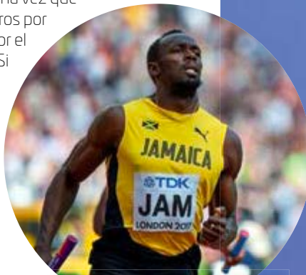
Usain Bolt tiene 8 medallas de oro y actualmente es el hombre más rápido del mundo, pues tiene el récord de 9.58 s en 100 m y de 19.19 s en 200 m.

Puedes calcular el tiempo en segundos y también en minutos. El número 50 indica que en el tiempo ( t ) el corredor ya había avanzado 50 metros y la gráfica que representa todos los posibles valores que puede tomar el tiempo y las distancias recorridas no comenzaría en cero.